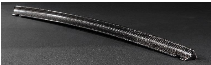
BONNET LIP & TRUNK REAR SPOILER